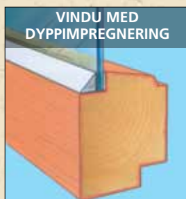
Dyppimpregnering gir mindre inntrenging i treverket enn vakuumpregnering.

Produktene må være overflatebehandlet før de utsettes for fukt. Overflatebehandlingen skal også beskytte mot UV-stråler, slitasje og forurensing. Standard leveres Røros Vinduer og Dører ferdig overflatebehandlet i fargene hvit eller Rørosrød, men alle NCS-farger kan leveres på forespørsel. Vinduene leveres med vedlikeholdsfri fugemasse i stedet for kitt. Fugemassen er overmalbar, men overmales ikke fra fabrikk.