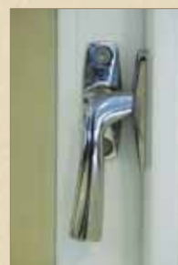
Blanke vridere på Røros Vinduet Original