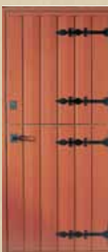
Y-6 Stalldør Y-6G Stalldør m/glass