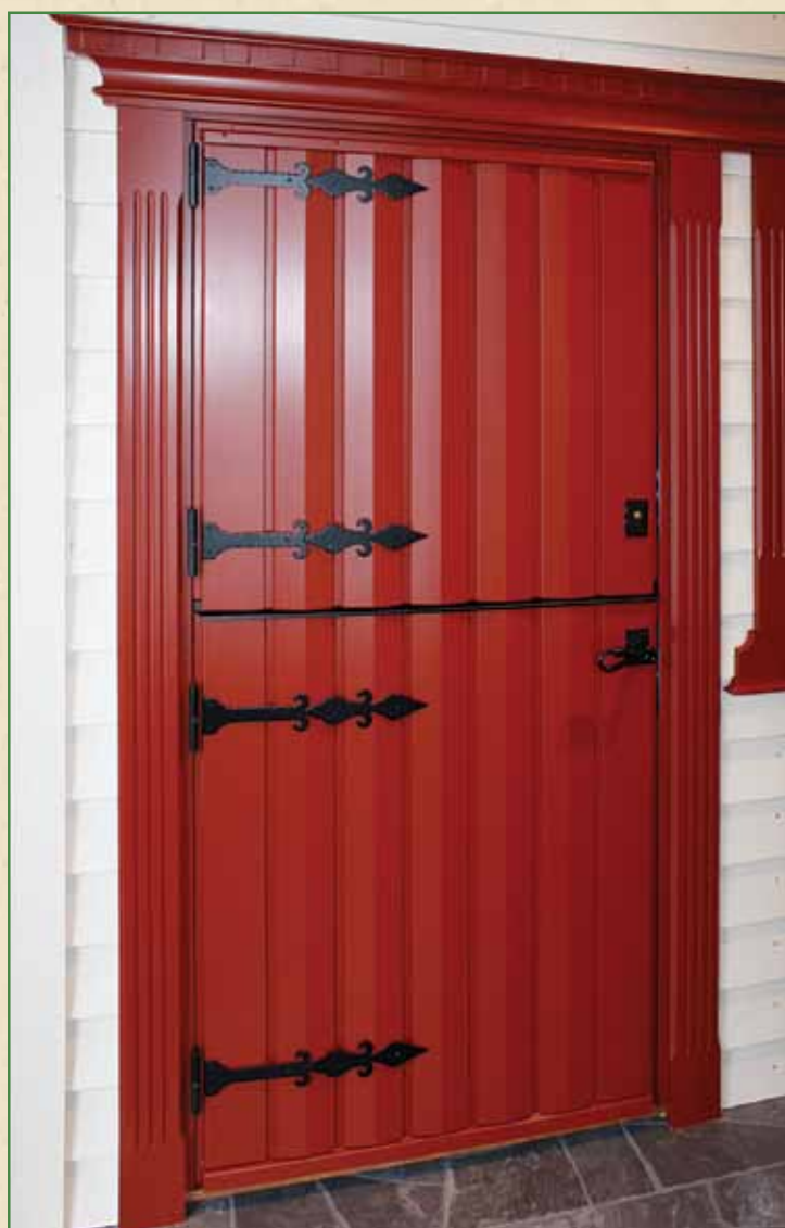
Y-6 Stalldør for deg som vil ha en helt spesiell ytterdør.

Ta kontakt med din lokale forhandler. Der får du den hjelpen du trenger, slik at eksakt den døren du ønsker deg kan settes i produksjon på Røros.