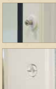
Koblingsbeslag med trykk-knapp system.