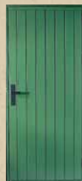
Y-97 Karstøtten Uisolert