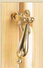
Hasper kan leveres i ulike utførelser på Røros Vinduet Original