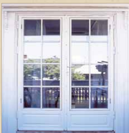
Røros 2-fløyet Terrassedør