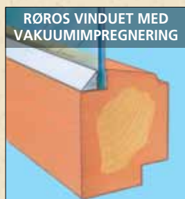
Vakuumpregnering trenger dypt inn i treverket og gir langvarig beskyttelse mot sopp og råte.