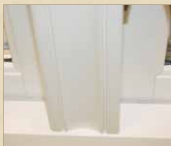
Profilert midtpost Røros Vinduet Original.