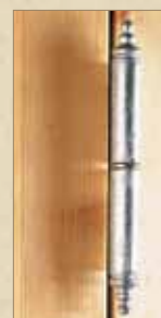
Hengsel med antikk pynteknapp, på Røros Vinduet Original