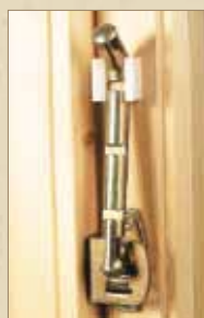
Sikkerhetsstormkrok for Røros Vinduet Original