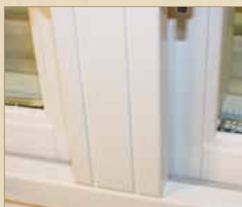
Profilert midtpost Røros Vinduet Standard.