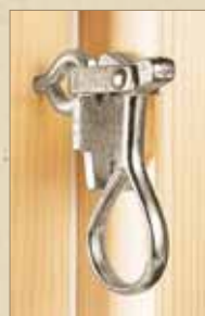
Blanke hasper Røros Vinduet Standard

Her vil det være muligheter for et bredt utvalg av ulike sprosseløsninger (faste og løse), og et bredt sortiment av andre detaljer og tilbehørsdeler. Karmdybde 117 mm.