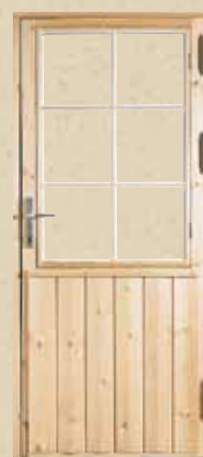
Røros Terrassedører. Vindushøyde og ruteinndeling etter eget ønske.